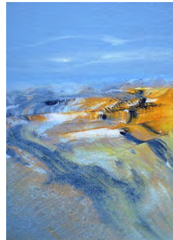
Hinrich JW Schüler: Abstrakte Landschaften