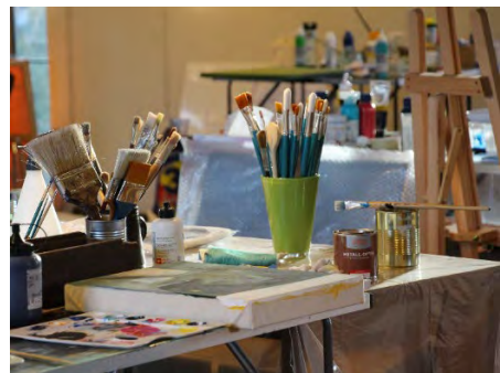
Kursszenen